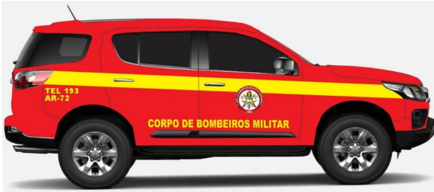
LAYOUT - CARRO DE PASSEIO -CBMMA