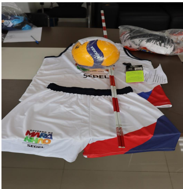
WPAN DISTRIBUIDORA - KIT VOLEIBOL