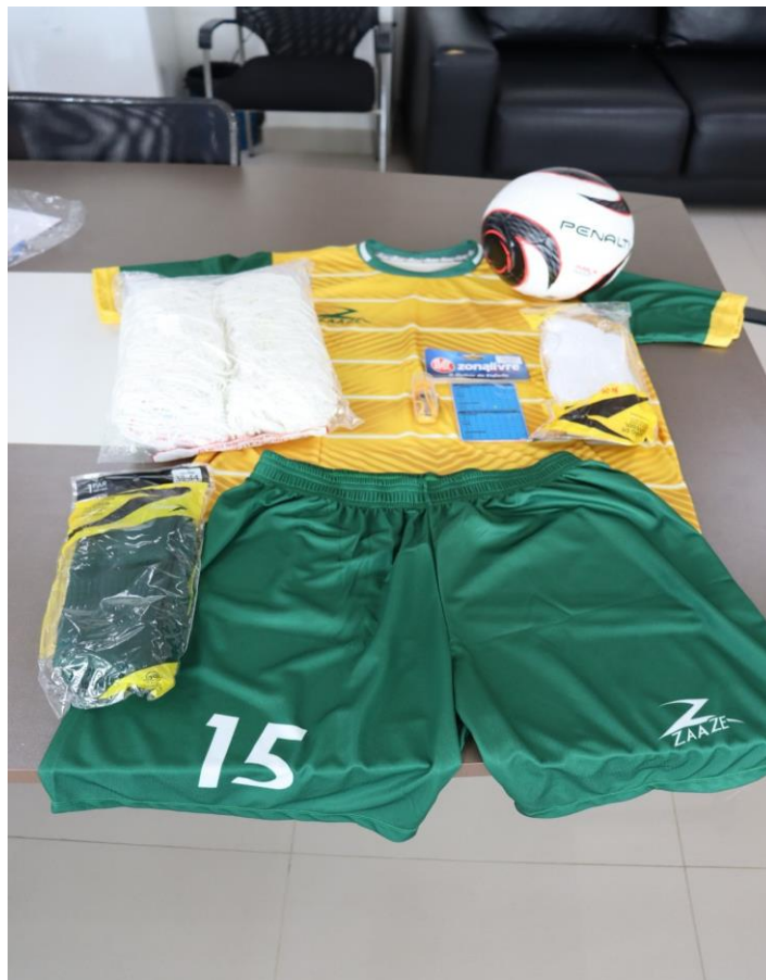
QUALITY COMÉRCIO E SERVIÇO - KIT FUTSAL