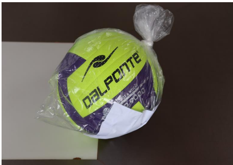
WPAN DISTRIBUIDORA - BOLA VOLEIBOL