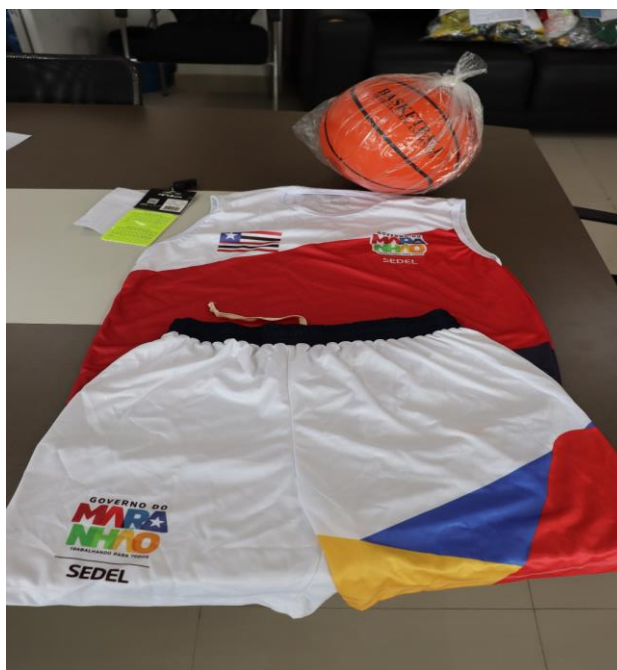
WPAN DISTRIBUIDORA - KIT BASQUETE