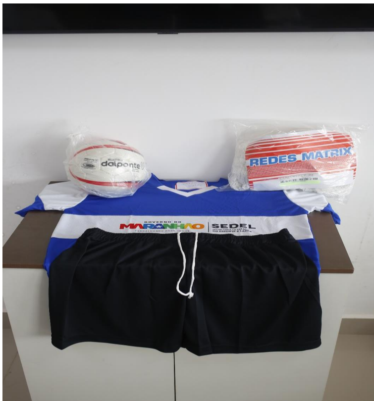
LCD - KIT - FUTSAL