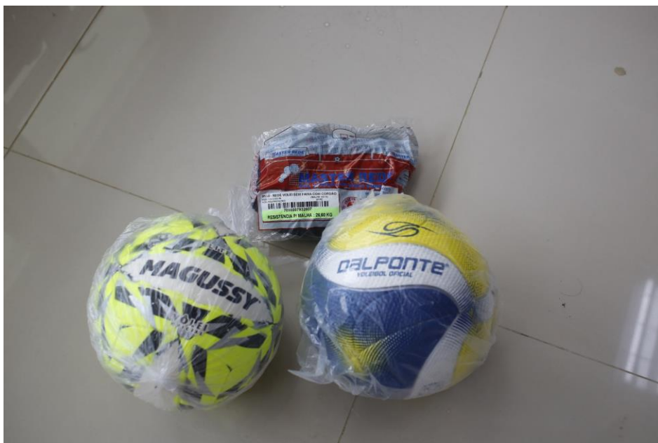
LCD - KIT VOLEIBOL