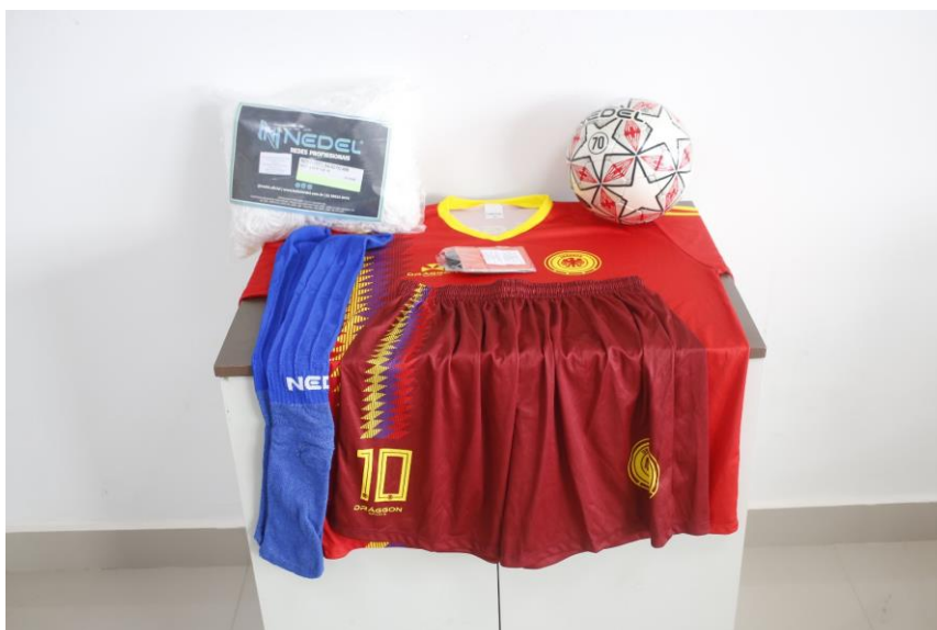
MAIS ESPORTE E COMÉRCIO – KIT FUTSAL