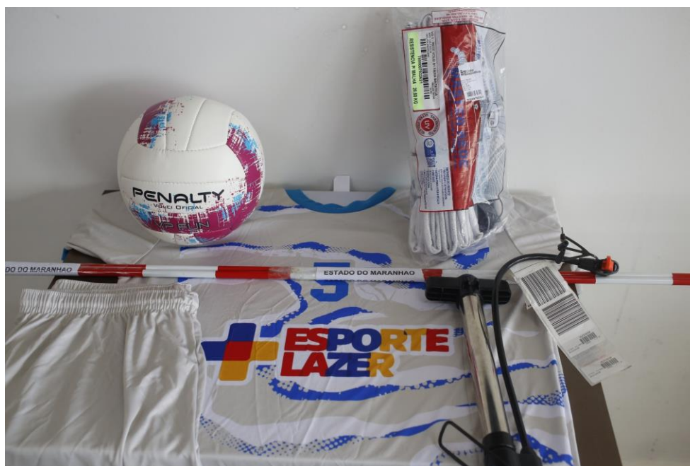
GGs – KIT VOLEIBOL