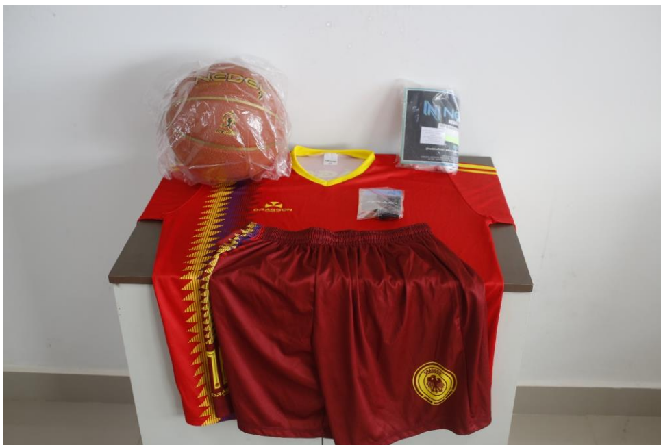
MAIS ESPORTE E COMÉRCIO – KIT BASQUETE