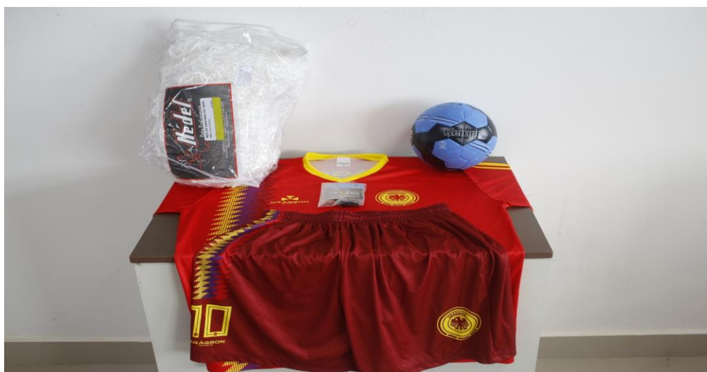
MAIS ESPORTE E COMÉRCIO – KIT HANDEBOL