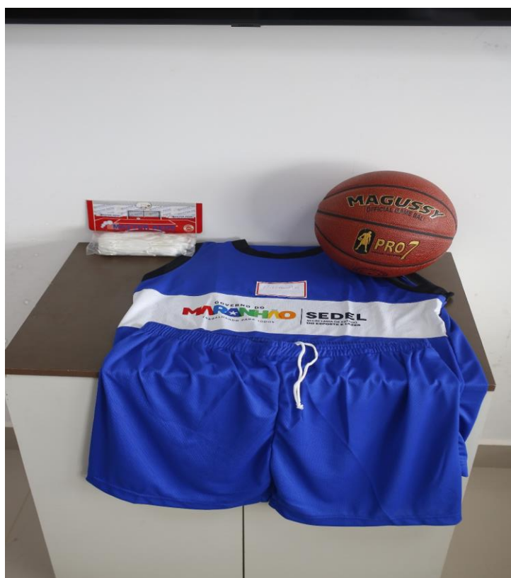
LCD- KIT BASQUETE