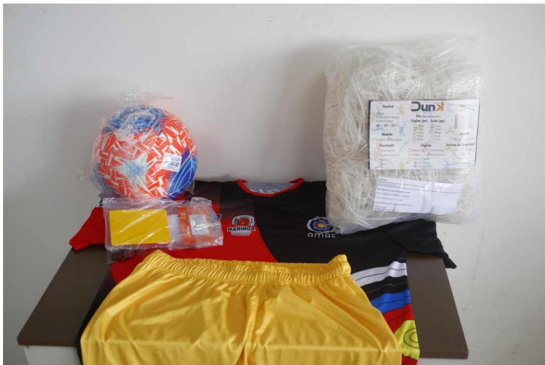
BIG BALL - KIT BEACH SOCCER