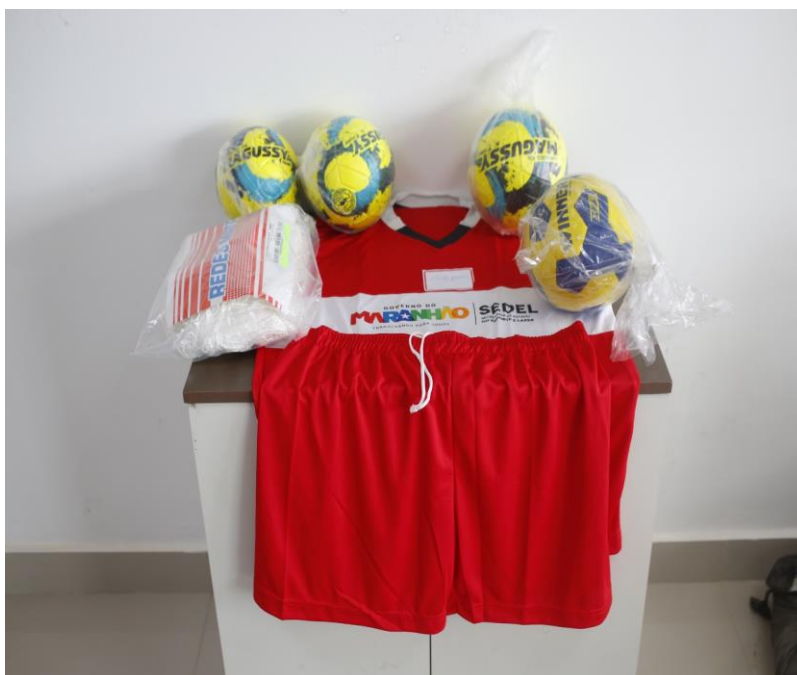
LCD - KIT - HANDEBOL