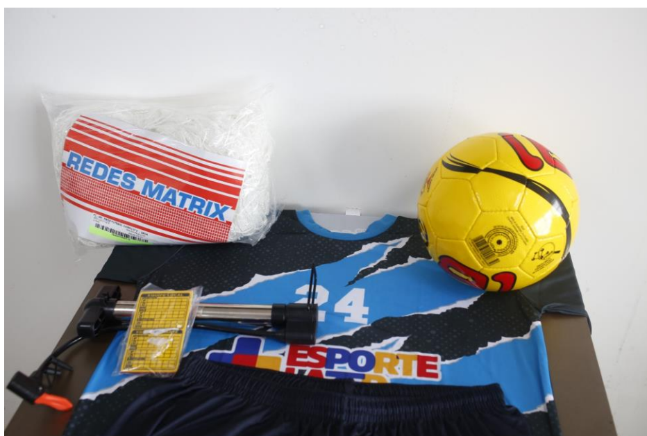
GGs- KIT FUTEBOL DE CAMPO