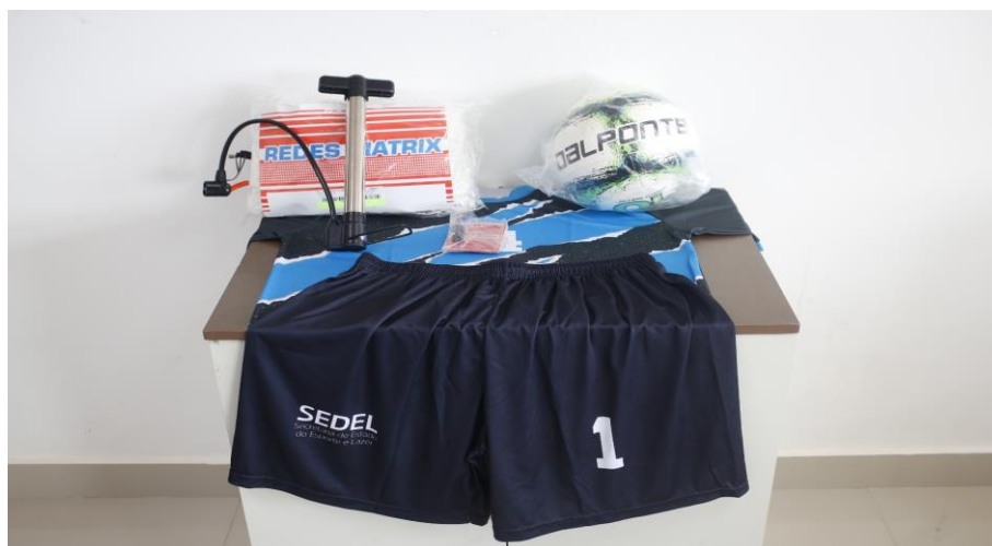
GGs – KIT BEACH SOCCER