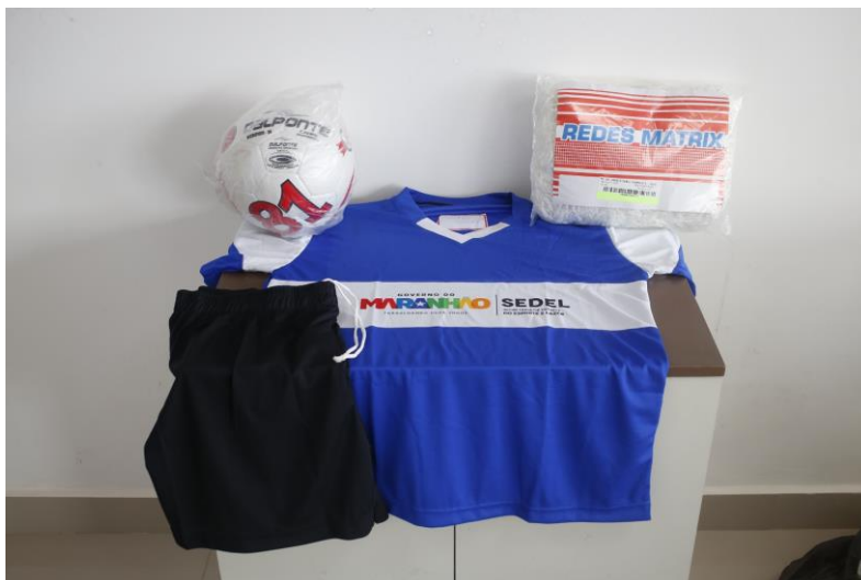
LCD - KIT - FUTEBOL DE CAMPO