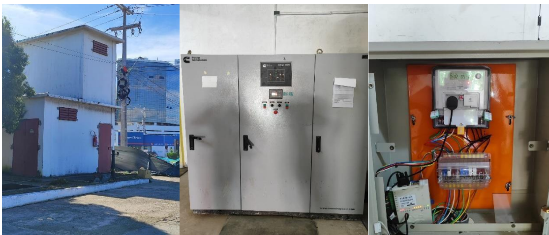
UNIDADE CONSUMIDORA – ED. JOÃO GOULART