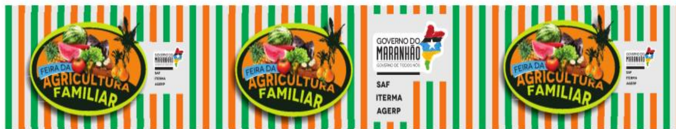
Lona Planificada - Parte de baixo da barraca